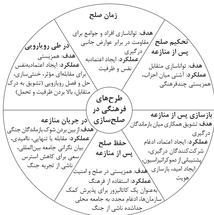
شکل ۲: نقش طرح‌های فرهنگی در صلح‌سازی