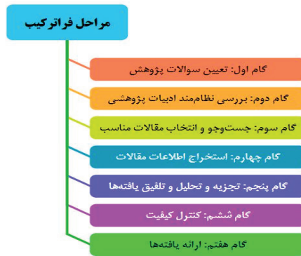
شکل ۱: مراحل فراترکیب (سندولوسکی و بارسو، ۲۰۰۷)

منحصربه‌فرد قابل‌دستیابی است؛ انجام می‌شود (Thorne & et al., 2004; Campbell). از آنجا که مطالعات انجام‌شده تنها به بررسی شایستگی‌های اخلاقی مدیران با تأکید بر بعد خاصی از تلاطم محیطی از قبیل عدم اطمینان، آشوب، بحران و... انجام شده‌اند؛ صورت‌بندی یک مطالعه فراترکیب به‌منظور کسب بینشی عمیق در این حوزه ضرورت دارد. در پژوهش حاضر از روش هفت مرحله‌ای سندولوسکی و بارسو (۲۰۰۷) استفاده شده است (شکل ۱).