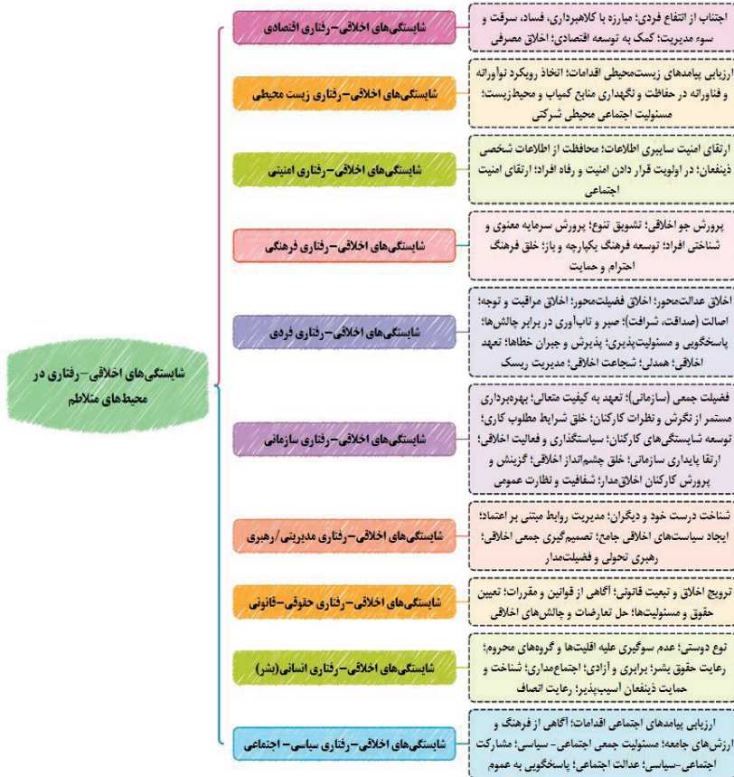
شکل ۳. مدل نهایی شایستگی‌های اخلاقی-رفتاری مدیران در محیط‌های متلاطم

با بررسی و تحلیل داده‌های استخراج شده از پژوهش‌های مرتبط با روش تحلیل مضمون، ۱۰ مضمون ثانویه شامل شایستگی‌های اخلاقی-رفتاری، ابعاد اقتصادی، زیست‌محیطی، امنیتی، فرهنگی، فردی، سازمانی، مدیریتی/رهبری، حقوقی-قانونی، انسانی (بشر) و سیاسی-اجتماعی، شناسایی گردید که به‌طور کلی ۵۸ مضمون اولیه را دربرمی‌گیرد. مدل نهایی پژوهش در شکل ۳ ارائه شده است.