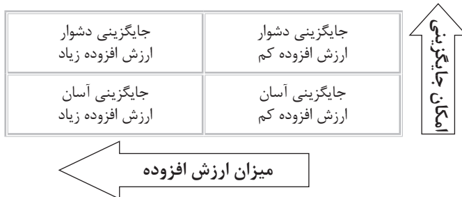
شکل ۱: طبقه بندی استعدادها بر اساس میزان ارزش افزوده و امکان جایگزینی

در این طبقه بندی استعدادها و نخبگان را در هر سطحی از سطح ملی تا سطح بنگاه می توان طبقه بندی نمود. به طوری که افراد را می توان در جدولی با دو محور میزان ارزش افزوده و امکان جایگزینی قرار داد و آنها را در چهار طبقه مطابق شکل ۱ دسته بندی کرد. اتخاذ هر نوع تصمیم در مورد مدیریت استعدادها نیازمند توجه به این رویکرد است. قرار گرفتن استعدادها در هر کدام از خانه های این جدول نحوه برخورد مدیران را با او مشخص خواهد کرد.