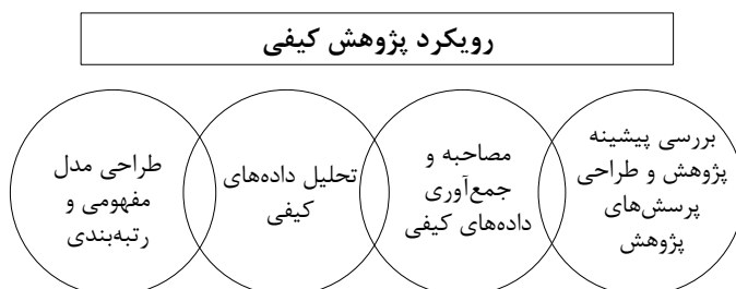
شکل ۱: مراحل اجرای بخش کیفی پژوهش

در مجموع مراحل اجرایی بخش کیفی این پژوهش را می‌توان به صورت شکل زیر به تصویر کشید: